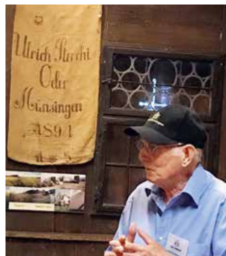
Mit Herz und Seele halten die Ölmänner die Öle Mühletal in Schuss.

Vielen Dank an die Organisatoren für diesen gelungenen Abend. jb