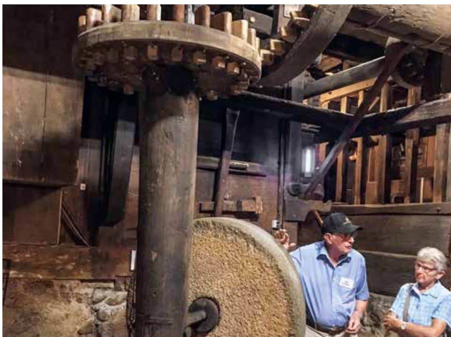
Ein mächtiger Grimsel-Mühlstein ist immer noch in der Öle in Betrieb.